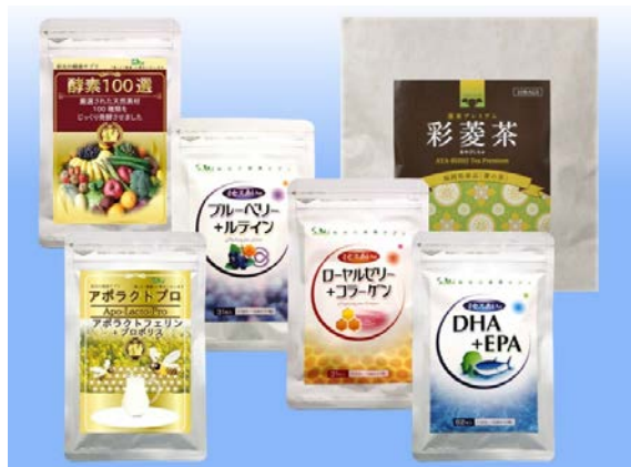
サプリメント類と彩菱茶

福岡県で研究開発された「あまおう」の栽培に取り組み、12月から4月にかけて地産地消商品として販売しています。また、筑後の伝統的食品である「菱」の栽培にも取り組んでいます。そのままおいしく食べていただくことはもちろん、様々な機能性を秘めた素材としての応用可能性にも注目しています。